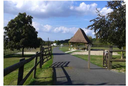
La belle aire de pique-nique du Billot Commune de Saint-Pierre-en-Auge

Un parc de 7 hectares avec des jeux pour enfants, des terrains de pétanque et volley-ball, de nombreux sentiers de randonnée pédestre ou VTT, des tables de pique-nique, un verger cidricole, un paddock pour les chevaux, bienvenue sur le site du Billot, véritable base nature et de loisirs. En famille, entre amis, entre sportifs, c'est le lieu idéal pour une journée au vert ! Situé à 200 mètres d'altitude, le site vous offre aussi un panorama exceptionnel sur la Vallée de la Vie et les plaines de Falaise et de Caen. (Normandie Tourisme)