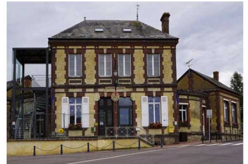
La mairie déléguée de Sainte-Marguerite-de Viette Commune de Saint-Pierre-en-Auge