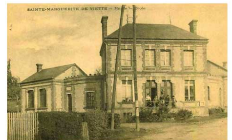
La mairie vers 1920