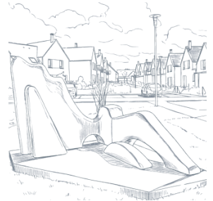
Oeuvre de Serge SAINT