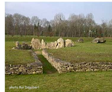
La Pierre Tournresse

L'église Saint-Hilaire fortifiée du XIII e siècle fait l'objet d'une inscription au titre des monuments historiques depuis le 16 mai 1927[35]. L'église est située sur une hauteur, elle fut un point stratégique durant la guerre de Cent Ans. Sa situation excentrée au nord du village serait due à la peste qui aurait ravagé le village autour d'elle. Les habitants se seraient alors déplacés dans le vallon de la Mue. (wikipédia)